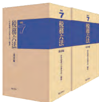
■日本税理士会連合会・編集 ■ぎょうせい刊行 A5判